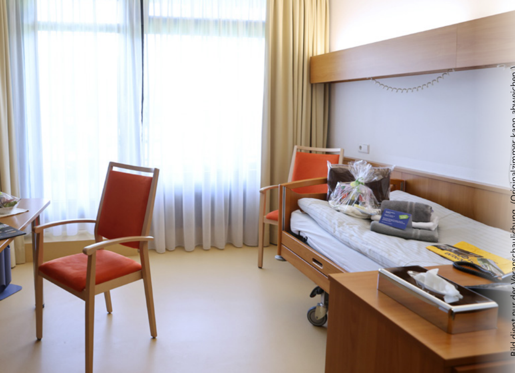
Bild dient nur der Veranschaulichung. (Originalzimmer kann abweichen.)